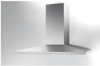
Cappa d'aspirazione Amélie 2447 090